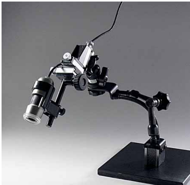
認定商品：サテライトアイ